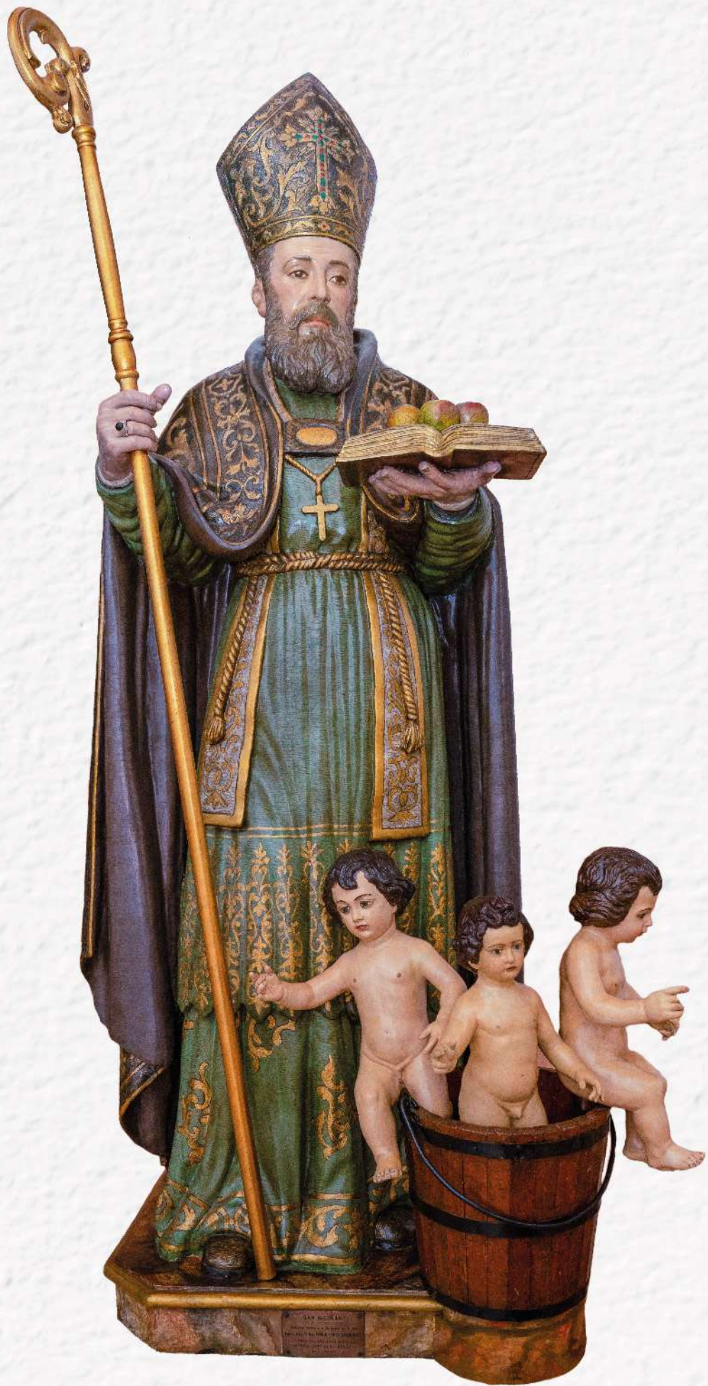
SAN NICOLA 1880 MILANO MILANO MILANO MILANO